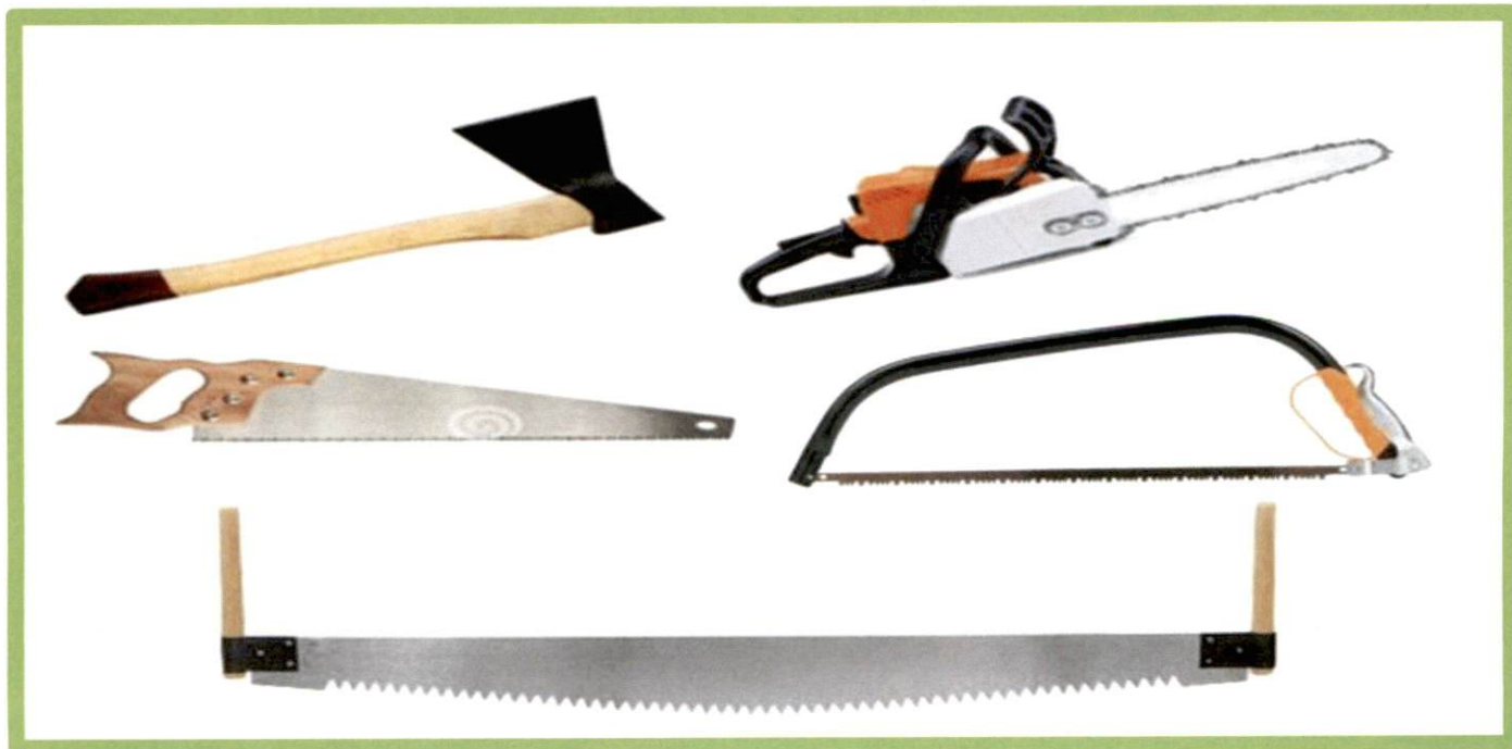
Изображение № 8 Разрешенные инструменты для заготовки

При заготовке валежника допускается применение ручного инструмента (ручных пил, топоров, бензопил) ( смотри изображение 8 ).