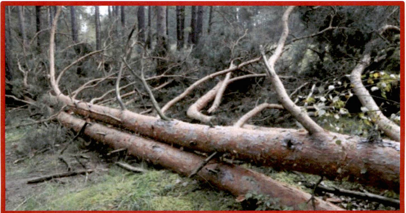
Лежащее на поверхности земли ветровалное дерево, не имеющее признаков отмирания. Не является валежником

Кроме того, необходимо обратить внимание, что деревья, которые лежат на земле, но не имеют признаков естественного отмирания (имеют зеленую листву или хвою), определять как «мертвые» не допускается ( смотри изображение № 5 ).